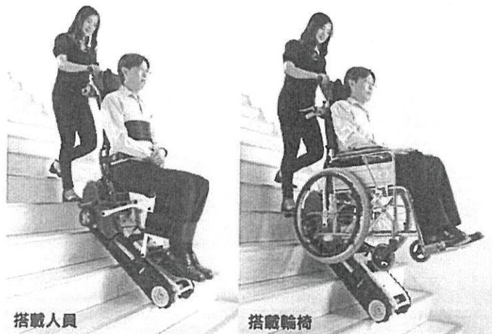
搭載人員與搭載輪椅，二機一體設計

決議：本案原則通過，惟基於優化支援服務協助原則及提昇友善環境，請提案設計單位依委員所提意見調整替代方案內容。