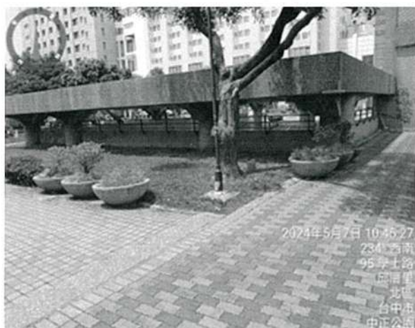
圖4、於人行通道路線增設花盆