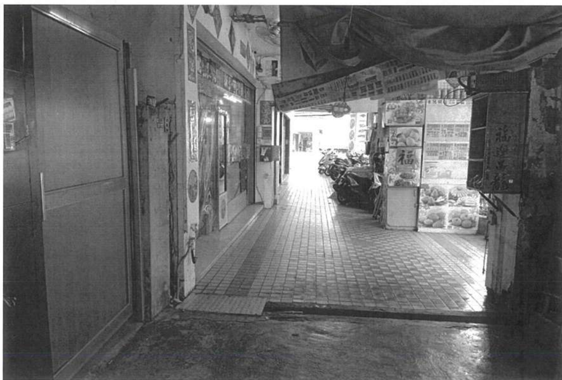
113年05月03日09時，勸導改善後。