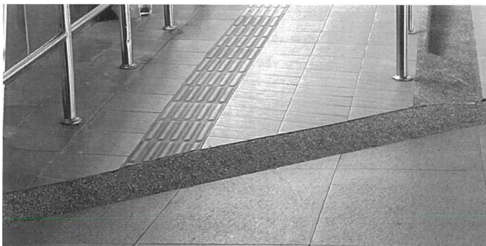
圖1、臺中捷運至高鐵站聯通之斜坡道設置導盲磚且端部斜率不一