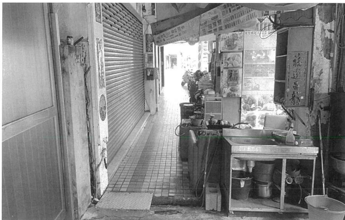
113年05月02日14時，勸導改善前。