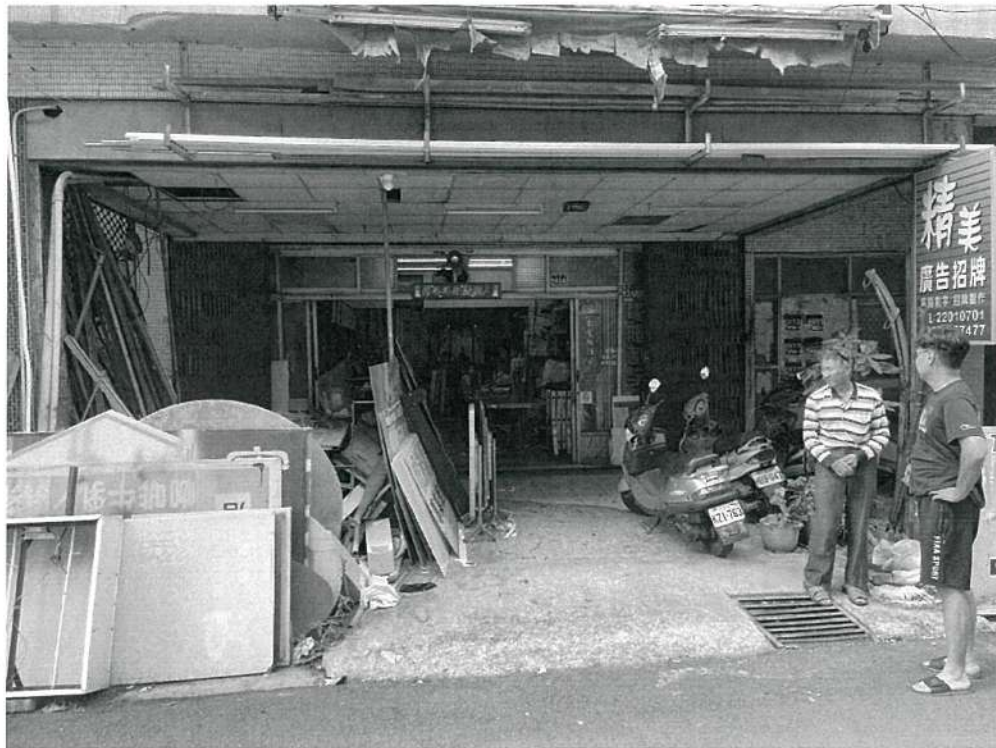
113年05月02日14時，勸導改善前。