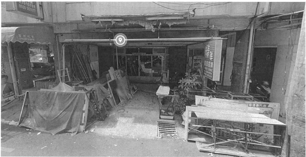
圖6、騎樓遭堆放雜物示意圖