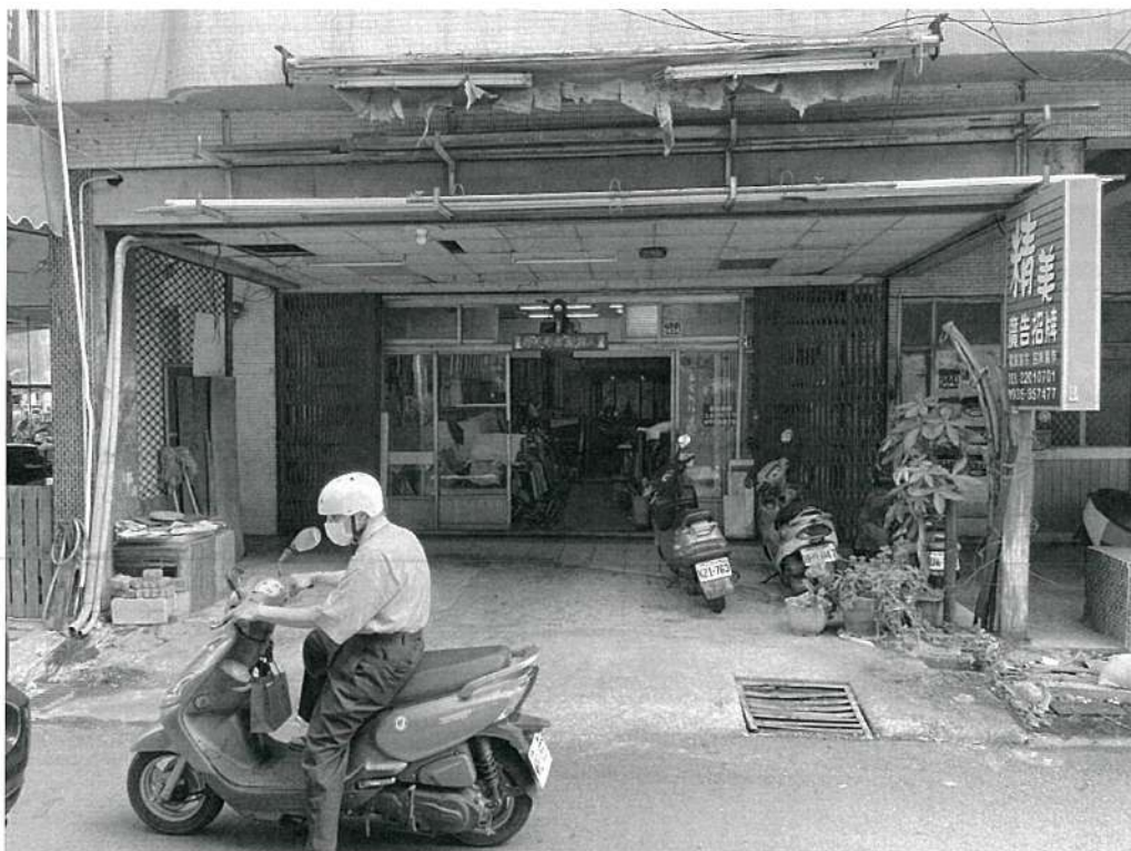
113年05月06日09時，勸導改善後。